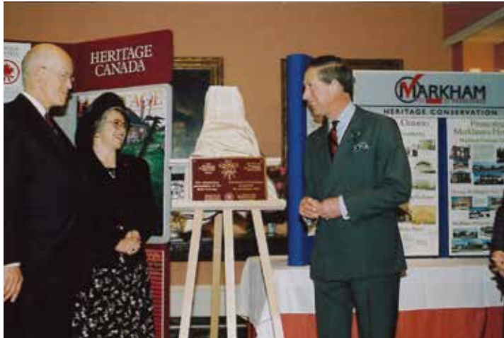
HRH, The Prince of Wales and HCF chair Trudy Cowan unveiling the first Prince of Wales Prize for Municipal Heritage Leadership plaque, presented in 2000 to Mayor Donald Cousens of Markham, Ontario.

HCF launched its Heritage Awards Program in 1974 as “a tangible recognition of the efforts of individuals, heritage groups or companies who have made an outstanding achievement in