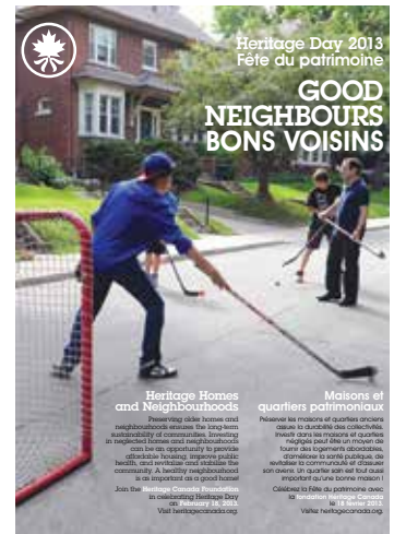
A sample of Heritage Day posters—one from each of the past four decades—produced by HCF since 1976.