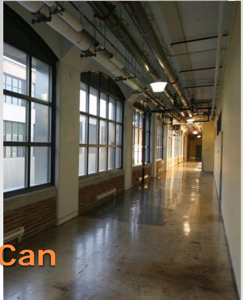
Édifice American Can