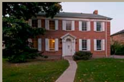
Sous-station 555, rue Spadina

Sheila Ascroft, rédactrice et réviseure à Ottawa, collabore à Héritage depuis 1997. Elle écrit aussi pour le magazine Ottawa Outdoors et le site www.womenscycling.ca . Vous pouvez la joindre à www.sheilaascroft.com .