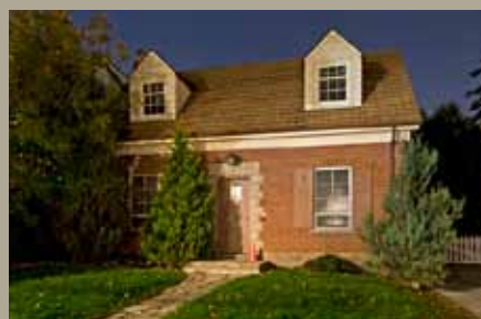
Sous-station 640, chemin Millwood