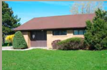
Sous-station maison Scarborough