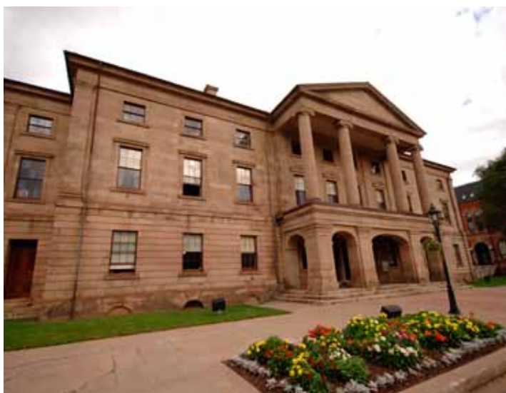
Conférence 2014 d'Héritage Canada La Fiducie nationale